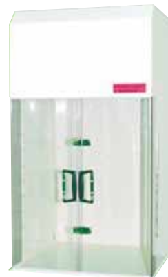
防音キャビネット 【SP-1】

超音波の照射時に起こる音を減少さ せることができます。長時間使用す る場合は、防音キャビネットに入れ てご使用下さい。